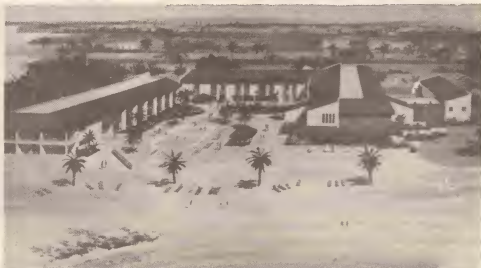
Pintura di e modernisimo hotelvakschool nobo cu lo bin pronto na Aruba.

Tambe Gobierno a otorga un record cantidad di becanan pa studiantenan di Aruba sigui studia tanto na Hulanda como na Merca.